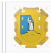
San Luís Potosí