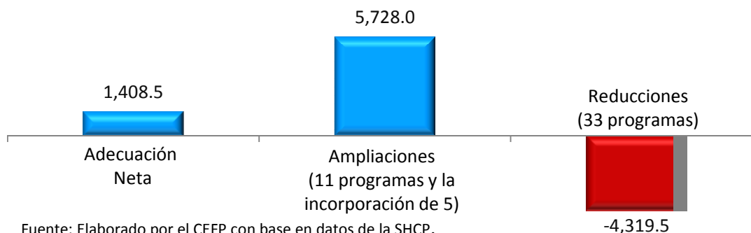
Gráfica 2 Ramo 04 "Gobernación": Adecuaciones Presupuestarias (Millones de pesos)