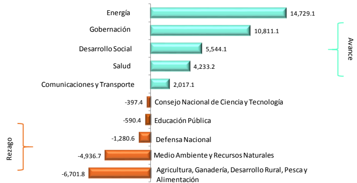
Principales Variaciones Nominales del Gasto Programable al cierre de Abril de 2015 Millones de pesos