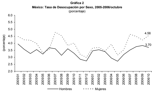
Fuente: Elaborado por el Centro de Estudios de las Finanzas Públicas de la H. Cámara de Diputados, con datos del INEGI, Encuesta Nacional de Ocupación y Empleo (ENOE), serie unificada.

TD desestacionalizada: Fue de 3.78 por ciento en octubre de 2006, cifra mayor en 0.10 puntos porcentuales a la del mes previo (ver gráfica 3). Por sexo fue la siguiente: hombres, 3.64 por ciento; mujeres, 4.13 por ciento.