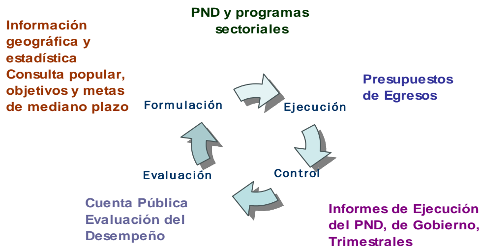
FIGURA 9 Proceso de Planeación