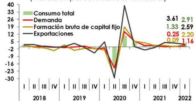
Demanda agregada y componentes 1/ 2018 - 2022 / I Trimestre (variación porcentual real trimestral)

1/ Cifras desestacionalizadas. Año base 2013=100. Fuente: Elaborado por el CEFP con información del INEGI.