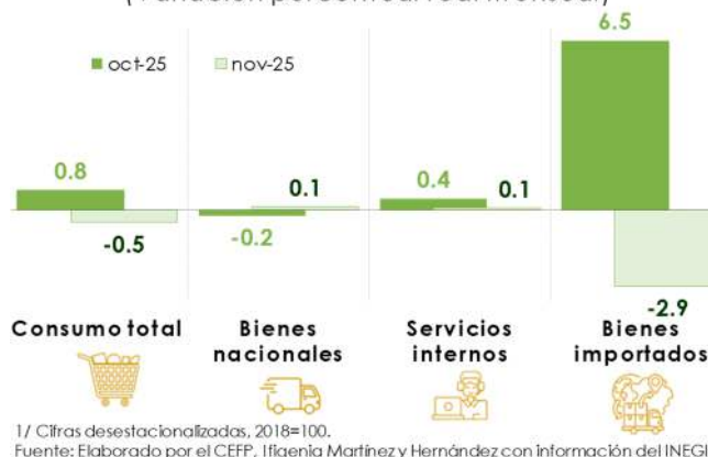
Consumo Privado en el Mercado Interior 1/ 2024 - 2025 / Noviembre (variación porcentual real anual)