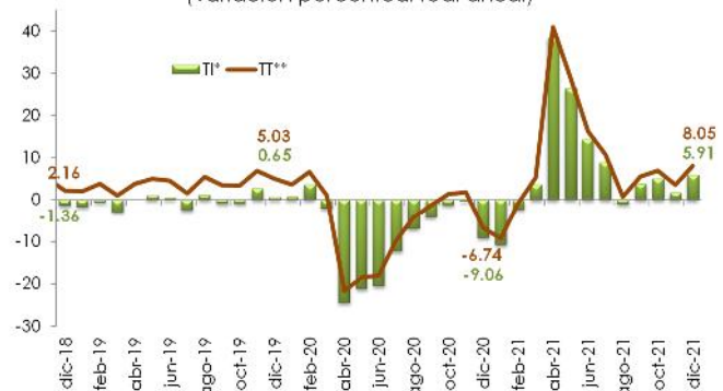
ANTAD: Ventas Totales, 2018 - 2021 / Diciembre (variación porcentual real anual)

Ventas acumuladas: Entre enero y diciembre de 2021, las ventas en las TI tuvieron un ascenso nominal promedio de 14.06% (en el mismo periodo de 2020 disminuyeron 5.02%), lo que implicó un incremento real anual de 7.92% , mientras que un año antes descendieron 8.14%. En las TT, las ventas registraron un alza nominal de 16.04% (-2.24% en enero-diciembre de 2020), lo que significó un crecimiento real anual de 9.80% (-5.45% en el mismo lapso de 2020).