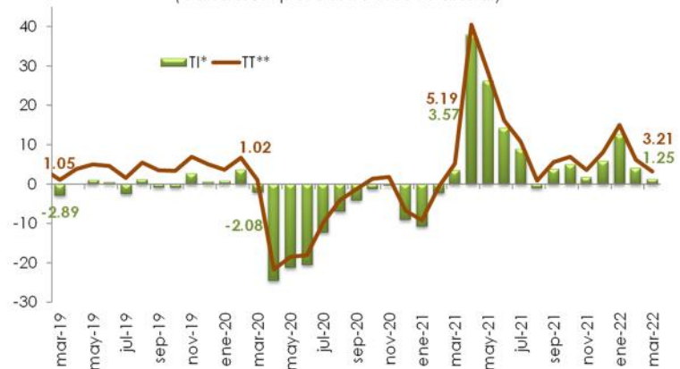
ANTAD: Ventas Totales, 2019 - 2022 / Marzo (variación porcentual real anual)

Ventas acumuladas: Entre enero y marzo de 2022, las ventas en las TI tuvieron un ascenso nominal promedio de 13.70% (en el mismo periodo de 2021 subieron 0.73%), lo que implicó un incremento real anual de 6.0%, mientras que un año antes descendieron 3.13%. En las TT, las ventas registraron un alza nominal de 15.97% (2.33% en enero-marzo de 2021), lo que significó un crecimiento real anual de 8.11% (-1.59% en el mismo lapso de 2021).