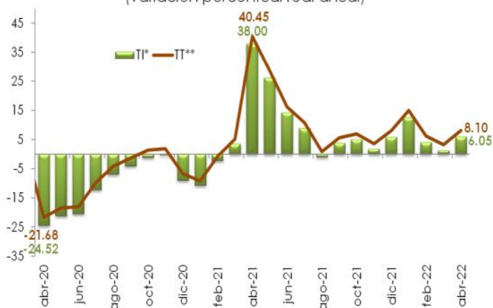
ANTAD: Ventas Totales, 2020 - 2022 / Abril (variación porcentual real anual)

Ventas acumuladas: Entre enero y abril de 2022, las ventas en las TI tuvieron un ascenso nominal promedio de 13.83% (en el mismo periodo de 2021 subieron 12.15%), lo que implicó un incremento real anual de 6.01%, mientras que un año antes ascendieron 7.31%. En las TT, las ventas registraron un alza nominal de 16.08% (14.0% en enero-abril de 2021), lo que significó un crecimiento real anual de 8.10% (9.08% en el mismo lapso de 2021).