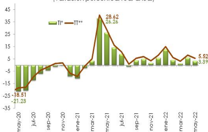
ANTAD: Ventas Totales, 2020 - 2022 / Mayo (variación porcentual real anual)

Ventas acumuladas: Entre enero y mayo de 2022, las ventas en las TI tuvieron un ascenso nominal promedio de 13.32%, dato inferior al observado en el mismo periodo de 2021 (16.46%). En términos reales implicó un incremento anual de 5.48%, mientras que un año antes ascendieron 11.14% real anual. En las TT, las ventas registraron un alza nominal de 15.58% (18.44% en enero-mayo de 2021), lo que significó un crecimiento real anual de 7.59% (13.03% en el mismo lapso de 2021).