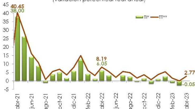
ANTAD: Ventas Totales, 2021 - 2023 / Abril (variación porcentual real anual)

* / Ventas a tiendas iguales (TI) ** / Ventas a tiendas totales (TT) Fuente: Elaborado por el CEFP con datos del ANTAD e INEGI.