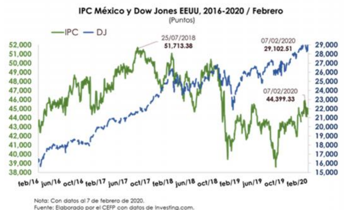
Mercados Accionarios, 2020

El comportamiento semanal del mercado bursátil mexicano se relaciona con un mejor entorno comercial, luego de que China anunciara la reducción de aranceles a los productos de Estados Unidos, en respuesta a una medida similar por parte de éste último. Sin embargo, los renovados temores sobre los efectos económicos derivados del coronavirus, limitaron las ganancias de la Bolsa.