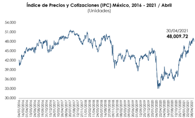
Nota: Con datos al 30 de abril de 2021.

El comportamiento semanal del principal mercado bursátil local, se relaciona con una mayor cautela y una toma de utilidades por parte de los inversionistas, luego de los niveles máximos que alcanzó el IPC la semana anterior.