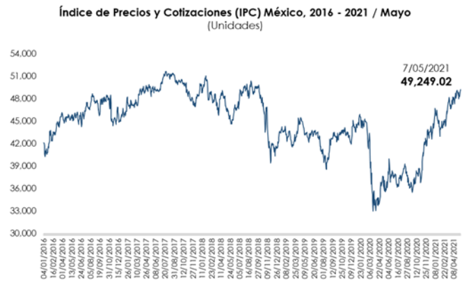
Nota: Con datos al 7 de mayo de 2021.

El comportamiento semanal del mercado bursátil mexicano se relaciona con los resultados trimestrales positivos que obtuvieron en su conjunto las emisoras que cotizan en la bolsa de valores; así como, la expectativa de que el Banco de México, mantendrá sin cambios su tasa de interés de referencia, ante el repunte de la inflación local.