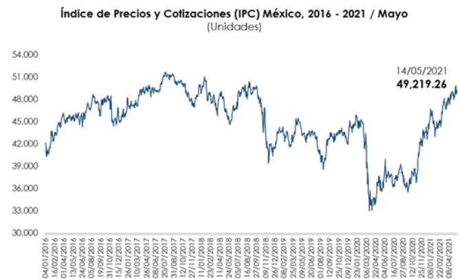
Nota: Con datos al 14 de mayo de 2021.

El comportamiento semanal del mercado de valores mexicano se relaciona con una toma de utilidades por parte de los inversionistas, luego de que la semana pasada, el IPC lograra alcanzar su nivel más alto del año.