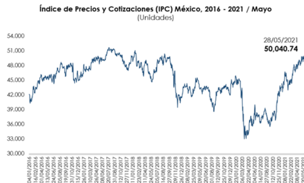
Nota: Con datos al 28 de mayo de 2021.

El comportamiento semanal de la principal bolsa de valores local se relaciona con una menor aversión al riesgo por parte de los inversionistas, ante la expectativa de una sólida recuperación económica de Estados Unidos y sus efectos positivos en la economía mexicana.