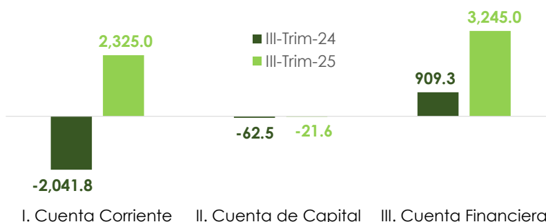
Saldos de las Principales Cuentas de la Balanza de Pagos, 2024-2025/III Trimestre (millones de dólares)

Fuente: Elaborado por el CEFP, Ifigenia Martínez y Hernández con datos del Banco de México.