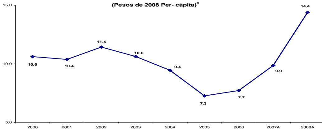
Gráfica 2 GASTO PROGRAMABLE DE LA SUBFUNCIÓN: DEPORTE 2000-2008 (Pesos de 2008 Per- cápita) e

A: Aprobado e/ Cifras estimadas a partir de los últimos resultados definitivos del Censo General de Población que publicó el INEGI, con base a la tasa de crecimiento para la población total que reporta CONAPO. Fuente: Elaborado por el Centro de Estudios de las Finanzas Públicas de la H. Cámara de Diputados con información de la Cuenta Pública 2000-2006 y Presupuesto de Egresos de la Federación 2007-2008 Aprobado.