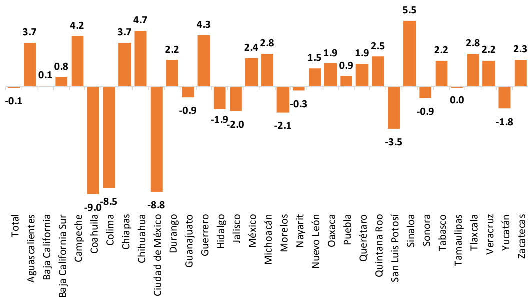
Tasa Anual de Crecimiento Real del Total del Gasto Federalizado Ejercido por Entidad Federativa, 2017-2018 (porcentaje)

Fuente: Elaborado por el Centro de Estudios de Finanzas Públicas de la Cámara de Diputados con base en datos de la Secretaría de Hacienda y Crédito Público.