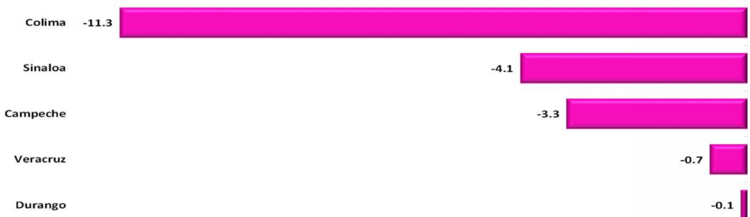
Entidades Federativas con las Menores Tasa de Crecimiento Real de las Participaciones Federales pagadas, a Febrero 2022 (porcentaje)