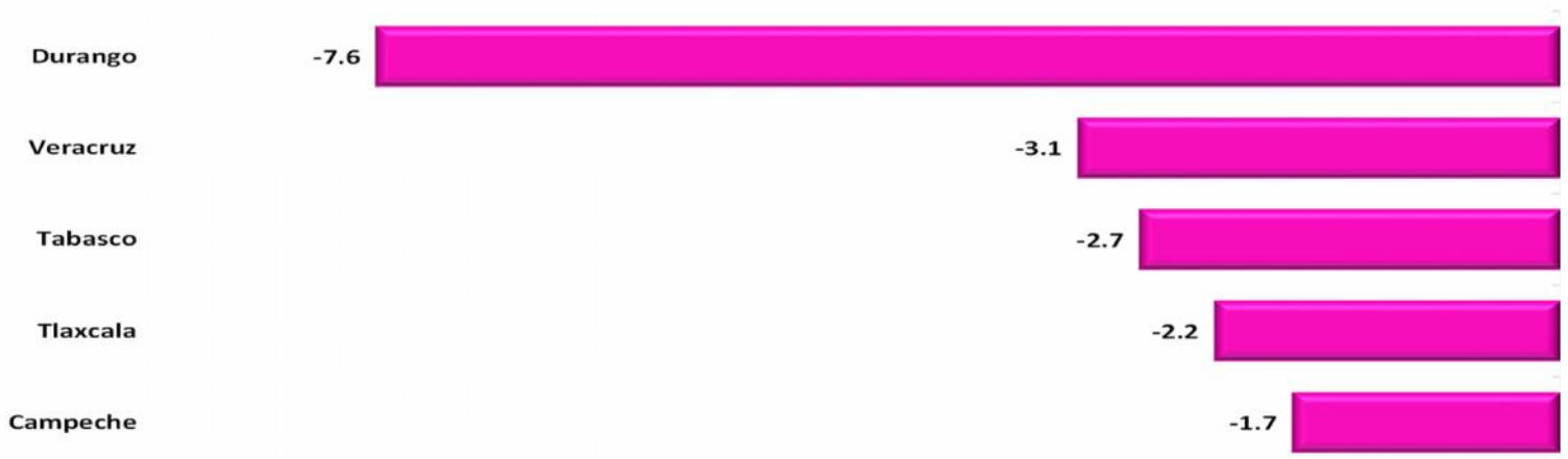
Entidades Federativas con las Menores Tasa de Crecimiento Real de las Participaciones Federales pagadas, a Abril 2022 (porcentaje)