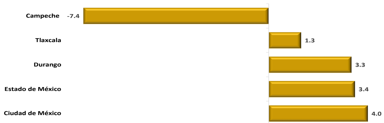
Entidades Federativas con las Menores Tasas de Crecimiento de las Participaciones Federales Pagadas contra las Calendarizadas, a Junio 2022 (porcentaje)