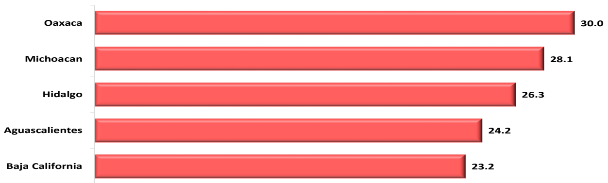
Entidades Federativas con las Mayores Tasas de Crecimiento Real de las Participaciones Federales pagadas, a Febrero 2024 (porcentaje)