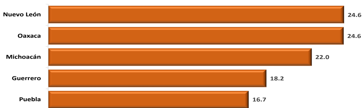
Entidades Federativas con las Mayores Tasas de Crecimiento de las Participaciones Federales Pagadas contra las Calendarizadas, a Febrero 2024 (porcentaje)