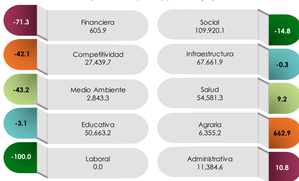
Programa Especial Concurrente para el Desarrollo Rural Sustentable Gasto Propuesto 2020 por Vertiente y variaciones reales PPEF 2020 vs PEF 2019 (Millones de pesos y porcentajes)

Fuente: Elaborado por el CEFP con información de la SHCP.