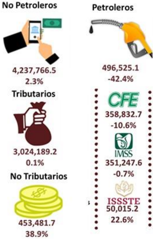
(Millones de pesos y Variación real anual)

de 2019, registraron una caída de 42.5 por ciento real, producto del desplome del precio del petróleo en 35.4 por ciento, la cual a su vez deriva de la caída de la demanda mundial de energéticos, tras el cierre de la actividad económica por la contingencia sanitaria del COVID-19 y la baja en 0.6 por ciento de la producción nacional de petróleo; a lo que debe agregarse la estrategia de recuperación de Pemex, mediante la cual se